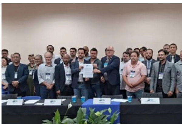
Divisão no Coridoce