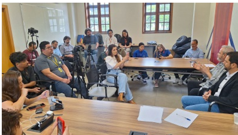
Jornalistas em coletiva

A coletiva de imprensa realizada na manhã desta quinta-feira (21) em Mariana trouxe à tona dois temas centrais: a insatisfação com os termos do acordo de repactuação para reparação dos danos da tragédia da Samarco e as discussões sobre a duplicação da estrada que conecta Mariana a Ouro Preto.