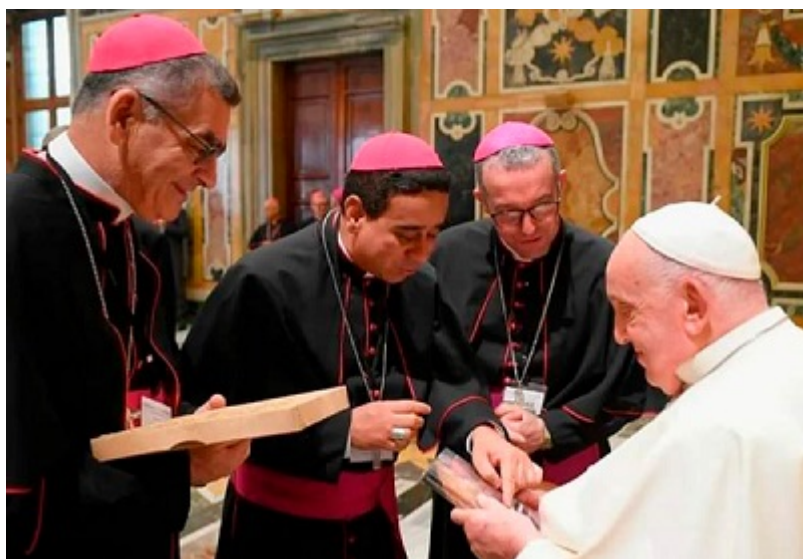
Papa Francisco segurando livro sobre a vida de Dom Luciano.

“Assim, querido e amado pelo povo de Minas Gerais, é sem dúvida justa e meritória a iniciativa de denominar Dom Luciano Pedro Mendes de Almeida o trecho da BR-356, entre o entroncamento com a BR-040 e a cidade de Mariana, cidade em que dedicou os últimos anos de sua vida”, escreveu o então relator da CE, em 2022.