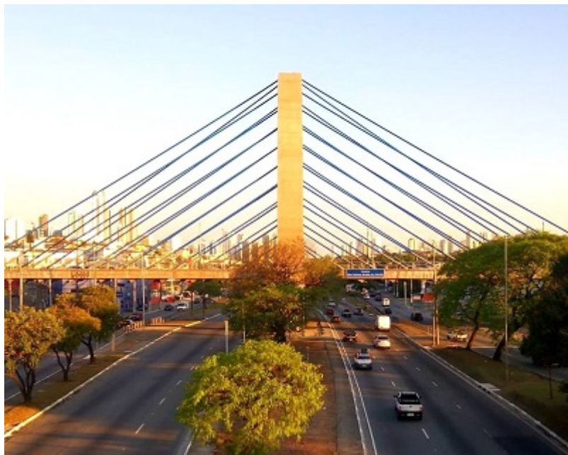
Viaduto Dom Luciano Mendes de Almeida na Zona Leste de São Paulo (SP).

O Senado Federal aprovou na tarde desta quarta-feira, 16 de outubro, o Projeto de Lei (PL) nº 6.571, de 2019 que nomeia um trecho de 80 quilômetros da BR-356 com o nome de “Rodovia Dom Luciano Pedro Mendes de Almeida” . O pedaço situa-se entre o entroncamento com a BR-040 e a cidade de Mariana (MG). Com a aprovação, a lei segue para sanção presidencial.