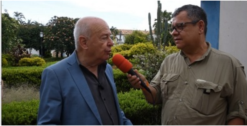
Prefeito Ângelo Oswaldo