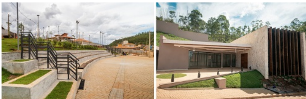
Obras da praça de São Bento e do templo da Assembleia de Deus foram concluídas em dezembro de 2022.